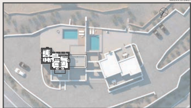
ΣΥΓΚΡΟΤΗΜΑ ΚΑΤΟΙΚΙΩΝ ΣΤΟΝ ΑΞΑΧΑ ΤΙΝΟΥ ΔΥΟ ΕΞΩΚΙΡΙΕΣ ΚΑΤΟΙΚΙΕΣ ΜΕ ΠΕΡΙΣΤΑ & ΘΕΑ ΤΟΝ ΟΡΜΟ ΠΑΝΟΡΜΟΥ