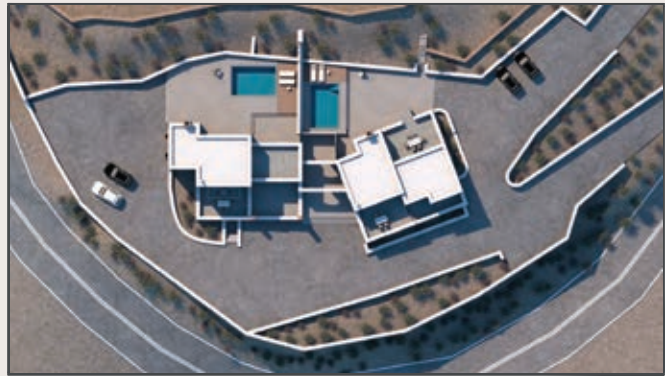
ΣΥΓΚΡΟΤΗΜΑ ΚΑΤΟΙΚΙΩΝ ΣΤΟΝ ΑΞΑΧΑ ΤΙΝΟΥ ΔΥΟ ΕΞΩΚΙΡΙΕΣ ΚΑΤΟΙΚΙΕΣ ΜΕ ΠΕΡΙΣΤΑ & ΘΕΑ ΤΟΝ ΟΡΜΟ ΠΑΝΟΡΜΟΥ

Στην κορυφή του ορεινού όγκου, στην πλαγιά του οποίου βρίσκονται οι κατοικίες, δεσπόζει, ντυμένο στα λευκά, το Μοναστήρι της Καταπολιανής των Υστερνίων. Σ' αυτό πρέπει πρώτα να πέφτει η ματιά και στο γύρισμά της να ανακαλύπτει, απρόσμενα ίσως, τις πέτρινες παρουσίες των σπιτιών. Εξάλλου δεν είναι τυχαίο, που οι Τηνιακοί τα σπίτια που έκτιζαν μέσα στους οικισμούς τους έδιναν λευκό χρώμα, ενώ σ' εκείνα που έκτιζαν έξω από αυτούς προτιμούσαν την εμφανή πέτρα. Ο προσανατολισμός των οικιών έγινε κατά τρόπο, ώστε να έχουν ανεμπόδιση θέα προς τη θάλασσα και τον όρμο του Πανόρμου, που κλείνεται από τη νησί-δα του Πλανήτη στην κορυφή του οποίου ορθώνεται ακόμα ο ομώνυμος παλιός φάρος. Εσωτερικά των οικιών δημιουργούνται διαφορετικά καθραρίσματα θέας προς τους γύρω ορεινούς όγκους και τα χωριά Πλατεία και Μαρλάς και την θάλασσα.